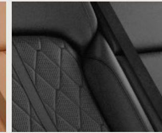
Interior en piel Palermo / Nappa en negro