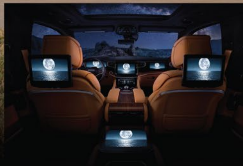
HASTA 75" DE SUPERFICIE TOTAL DE PANTALLAS