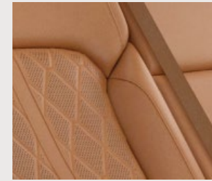
Interior en piel Palermo / Nappa en camel