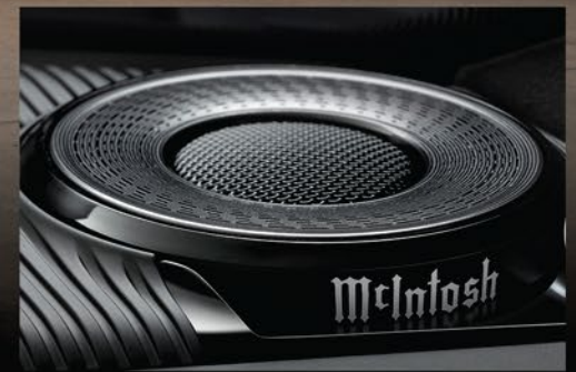
PRIMER SISTEMA DE AUDIO McINTOSH® DE LA INDUSTRIA