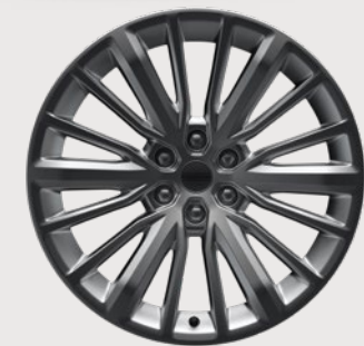
Rines de aluminio de 22"