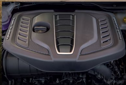
MOTOR 3.0L TWIN-TURBO